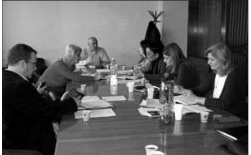
Седница Одбора предшколаца

На Одбору је покренута иницијатива за измену Закона о ПИО у делу изналажења решења за запослене у предшколским установама који непосредно раде са децом, како би се због физичког оптерећења и професионалних обољења, бенефицирао радни стаж. Чланови Одбора су изнели и друге проблеме у срединама које заступају, а посебна пажња је усмерена на стање у ПУ "Наша радост" у Суботици, где је локална власт отпустила неколико